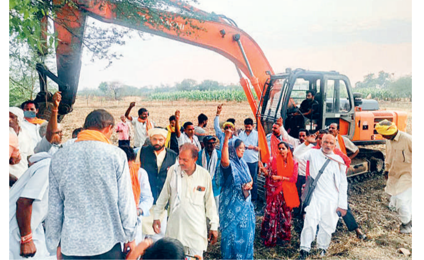
कवर्धा। हाल ही में भारतीय किसान संघ की मांग के बाद जिले के विकासखण्ड स.लोहारा की लबित पड़ी सुतियापाट नहर नाली विस्तारिकरण कार्य का किया गया शुभारंभ