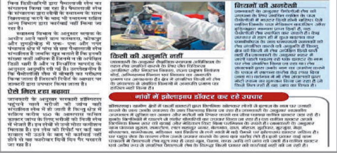
डिग्रीधारी लेब में जांच कर रहे रोगियों की जांच

क्षेत्र में अवेध लेब संचालित, अधिकारियों का ध्यान नहीं बिना डिग्रीधारी लेब में कर रहे रोगों की जांच